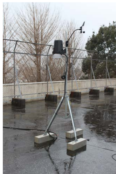
図1 ウェザーステーション・プロ2

生徒が大気調査を実施するために、本館屋上にウェザーステーション・プロ2を平成25年度の地学科の予算で購入・設置し、平成26年1月から観測を開始している(図1参照)。屋上にあるウェザーステーション・プロ2の本体からケーブルを伸ばし、本館1階の地学実験室にあるコンソールとをつないでいるので、観測データは屋上に行かなくても、生徒は地学実験室で、常に見ることができるようになっている。降水のpHの測定のためには、pHメーターを使用している。