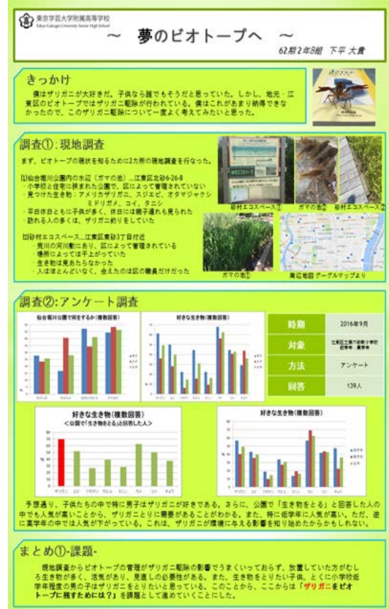
図7 ポスター (1枚目)