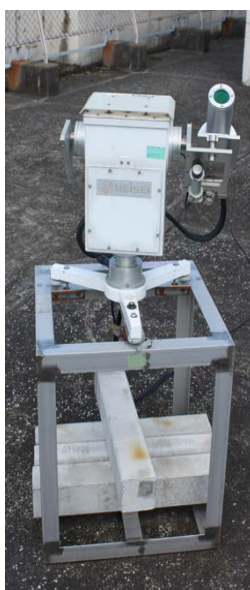
図3 CO 2 の観測装置

さらに、平成26年7月1日以来、川口 昌博 客員教授(名古屋大学 太陽地球環境研究所)、中野 幸夫 准教授(東京学芸大学)、今須良一 准教授(東京大学 大気海洋研究所)からの依頼で、都心におけるCO 2 データの取得のため、CO 2 の観測装置を本館屋上に設置している(図3参照)。この観測は、温室効果ガス観測技術衛星「いぶき」(GOSAT)による関東集中観測において、都市部でCO 2 の推定誤差が大きかったことから、さらに観測データを取得して検討する必要がある、本校が最も誤差が大きかった地域に位置し、検証観測機器設置場所として適していたため、実施されることになったものである。