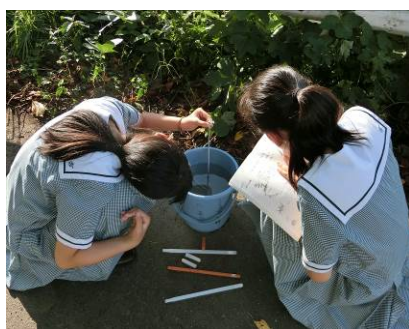
図2 水質調査の様子

グローブの活動は、放課後、部活動と同様に特別活動として行っている。活動主体は、年度初頭の募集時に参加を希望した生徒である。今年度より立ち上げた背景として、本校で行っている環境教育が学年の特色に影響されていることが挙げられる。これを補強する形で、一貫した環境教育の核を作り、学年毎の環境教育に関係性を持たせようと考え、水質調査を主体とする団体を立ち上げた。理科の授業の延長線上にある観察や分析を中心に、水質と棲息プランクトンの関係性や外来種への課題発見や地域社会での環境課題まで将来的に広げられていく団体を目標としている。