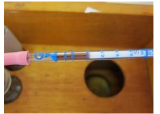
検知管による硫化水素量測定の様子