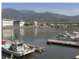
来村川河口 (板島橋下流)