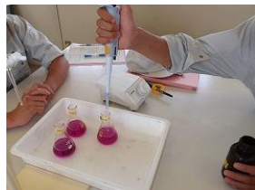
CODの測定 (試薬の混合)