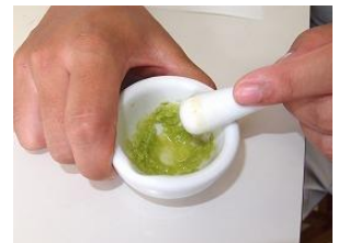
ろ紙のホモジナイズ