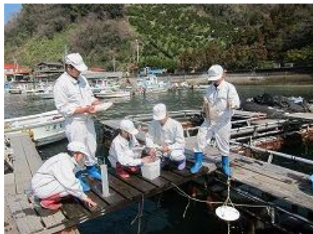
⑤ 観測時間 「坂下津生簀」での観測の様子

観測回数及び観測者については、「学校浮き桟橋」は、水産増殖科1年生が週に2回(月、木)、「坂下津生簀」は、水産増殖科2年生が週3回(月、水、金)の観測を目安に行った。また、観測は、各クラスの生徒全員が輪番で行った。これらは、平成22年9月から継続的に実施しており、平成26年3月14日までの実施回数は「学校浮き桟橋」は276回、「坂下津生簀」は、363回、2定点の合計は639回であった。