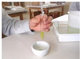
アセトンでの色素抽出