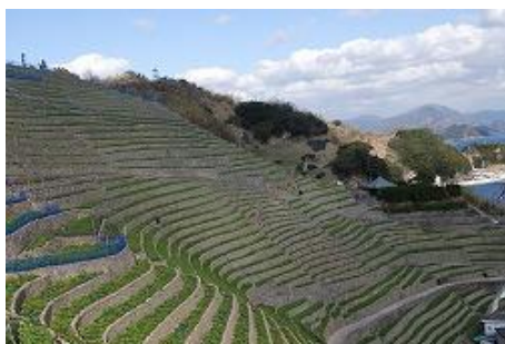
宇和島市遊子 段畑