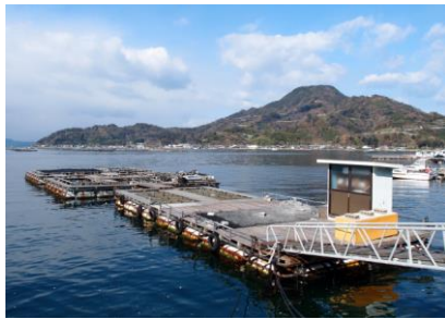
観測地点「坂下津生簀」