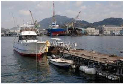
観測地点「学校浮き桟橋」

「学校浮き桟橋」(School Pier)(1年生)、小型実習船で15分程度の距離にある本校の実習用生簀「坂下津生簀」(Sakashizu Pier)(2年生)の2か所の海域を定点とした。